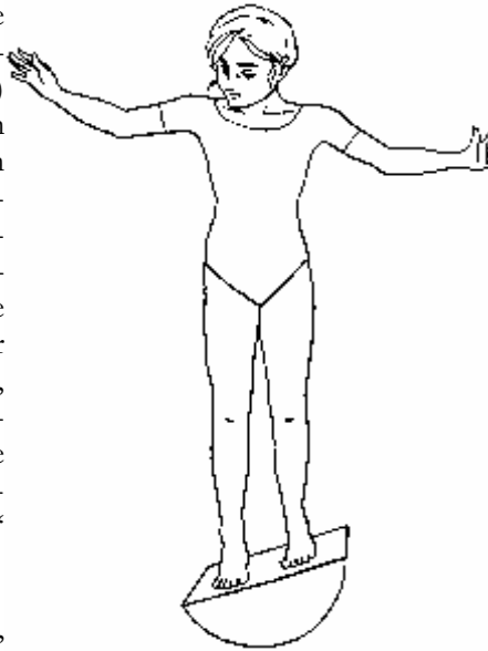
Abb. 1: Das Kind zeigt vermeintlich ein Defizit der vestibulär propriozeptiven Verarbeitung, weil es auf dem Kippbrett die Arme nach oben hebt, den Blick auf den Boden richtet und Hüfte und Bein auf der ansteigenden Seite des Brettes nicht beugt.

Eine „vestibuläre Dysfunktion“ wird festgestellt anhand des „ab-